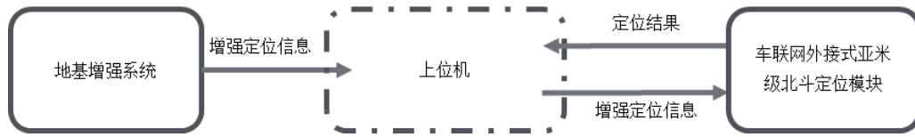
图2 模块与上位机之间的数据交换